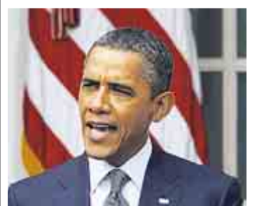
US-Präsident Barack Obama am Montag in Washington

Dass Obama den Haushalt zur Hälfte durch höhere Einnahmen sanieren will, ist gegenüber den Republikanern eine Provokation. Doch Obama will sich nun für den Präsidentschaftswahlkampf als Anwalt des kleinen Mannes neu erfinden – und sei es um den Preis, dass seine politischen Konzepte teilweise nur Wunschzettel sind. Die Wahl 2012 werde einen eindeutigen Kontrast ermöglichen: „Wenn wir uns die ansehen, wohin sich die Republikaner bewegen, dann sehen wir eine Partei, die eine fundamental andere Vision hat, wie Amerika sein sollte.“