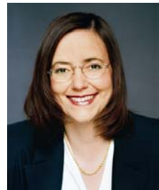
Mitglied des Deutschen Bundestages Außenpolitische Sprecherin B90/Die Grünen